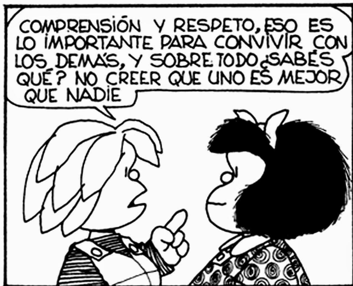
Ilustración 1 Mafalda nos invita a respetar al otro y a no creernos más ni mejor que los demás

Lo que haremos es escribir en papelitos individuales los nombres de todos los integrantes de tu familia o grupo de personas con las que vives e introducirlos en una bolsa; luego, cada