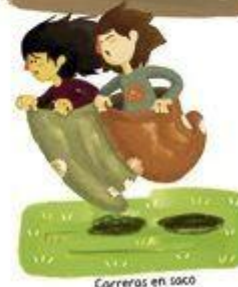
Carreras en saco