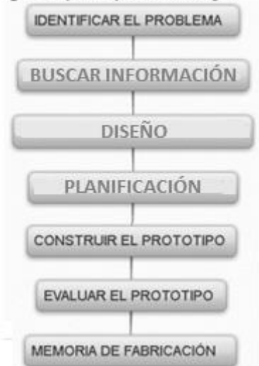
Fig 2: Etapas del proceso tecnológico.