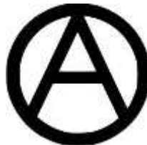
SÍMBOLO DEL ANARQUISMO

Se conoce como anarquismo a un sistema filosófico y una teoría política que corresponde a la ausencia del gobierno. La palabra anarquismo es de origen griego “ ánarkhos ”, que significa sin gobierno o sin poder.